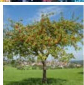
Aménagement • p 11 Un arbre planté pour chaque naissance