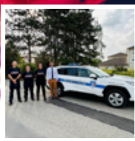
Sécurité • p 14 Trois nouveaux agents pour notre sécurité